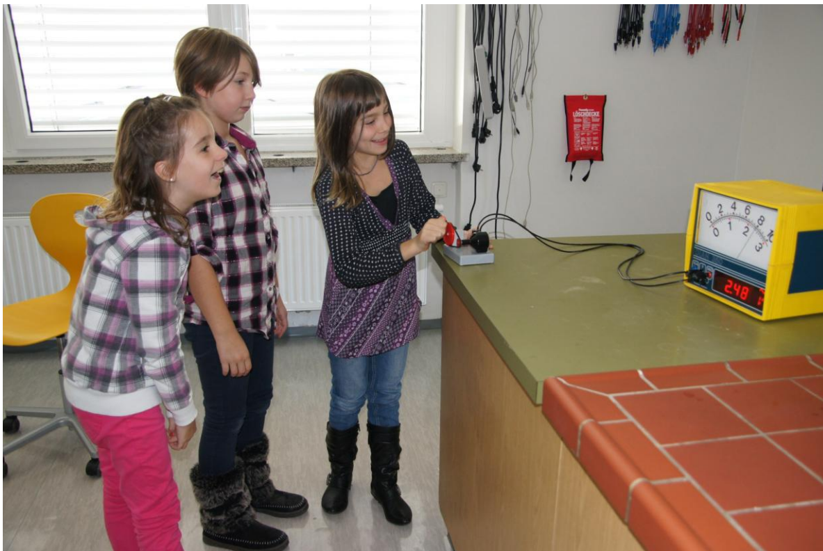
Das Messgerät zeigt die Spannung.