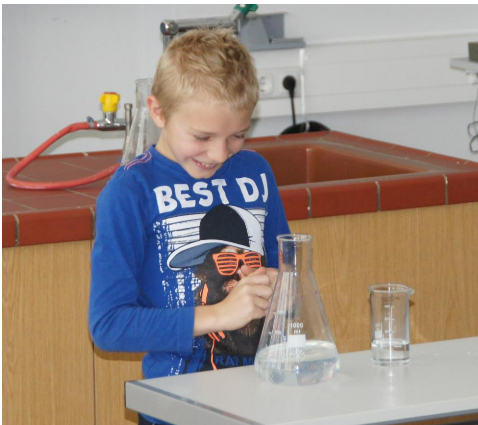
... und hat Erfolg!